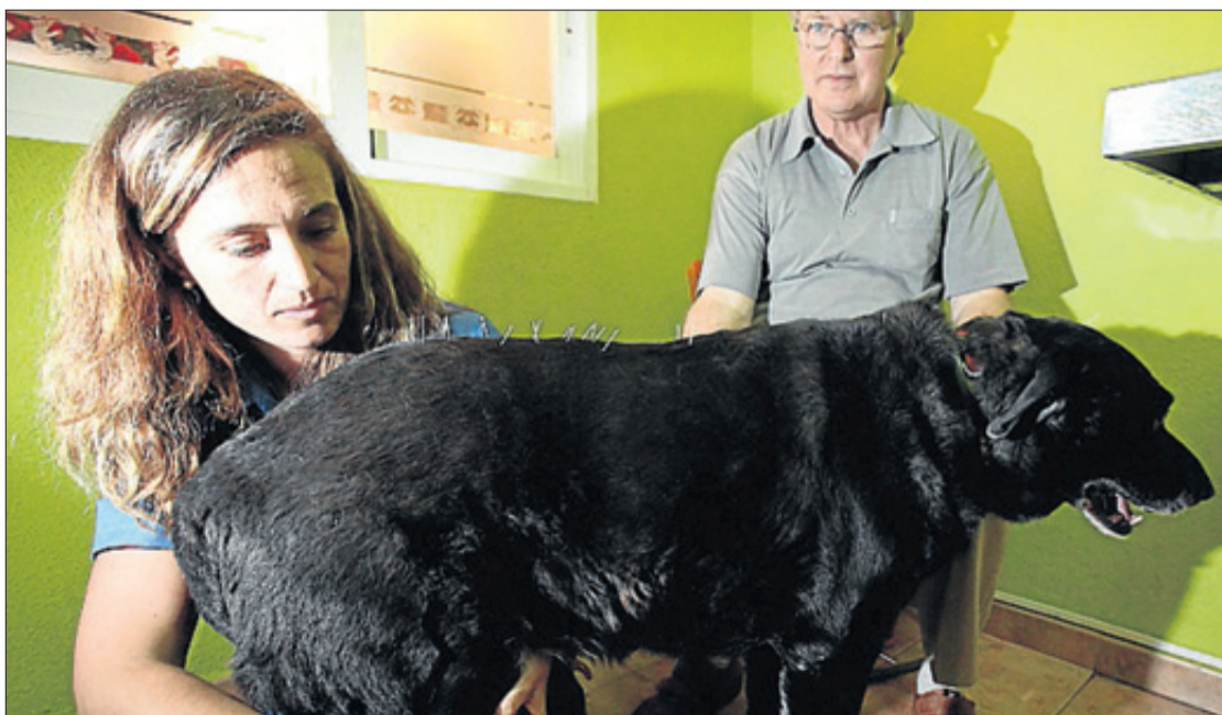
Isis, una perra de 12 años, está recibiendo un tratamiento con acupuntura.