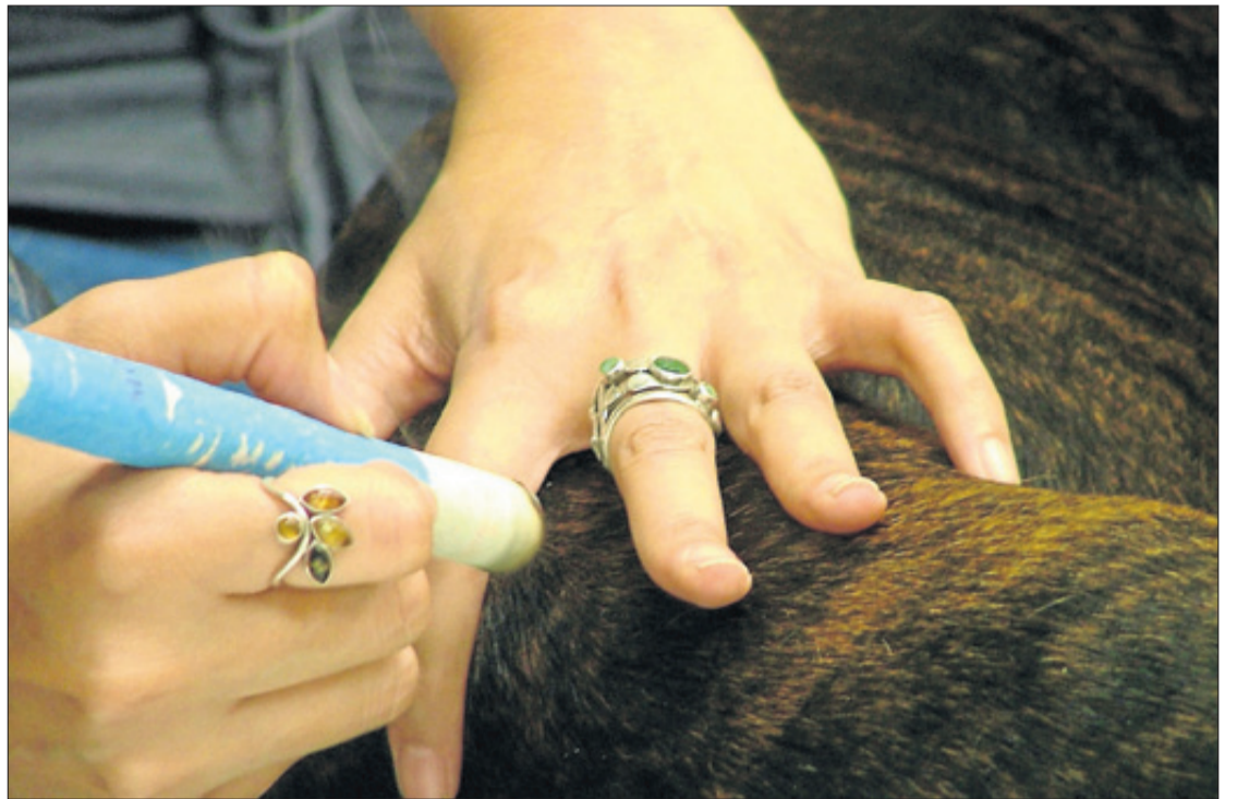
Las alternativas en los tratamientos favorecen otros aspectos físicos de las mascotas.

En animales de mayor tamaño, el uso de la acupuntura más fre-