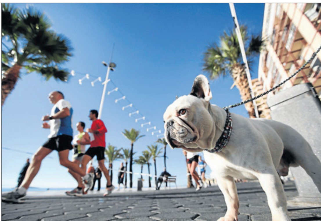
En España se contabilizan más de 23 millones de animales de compañía.

Los centros veterinarios en Alicante, ofrecen prestaciones que facilitan el tratamiento de los ani-