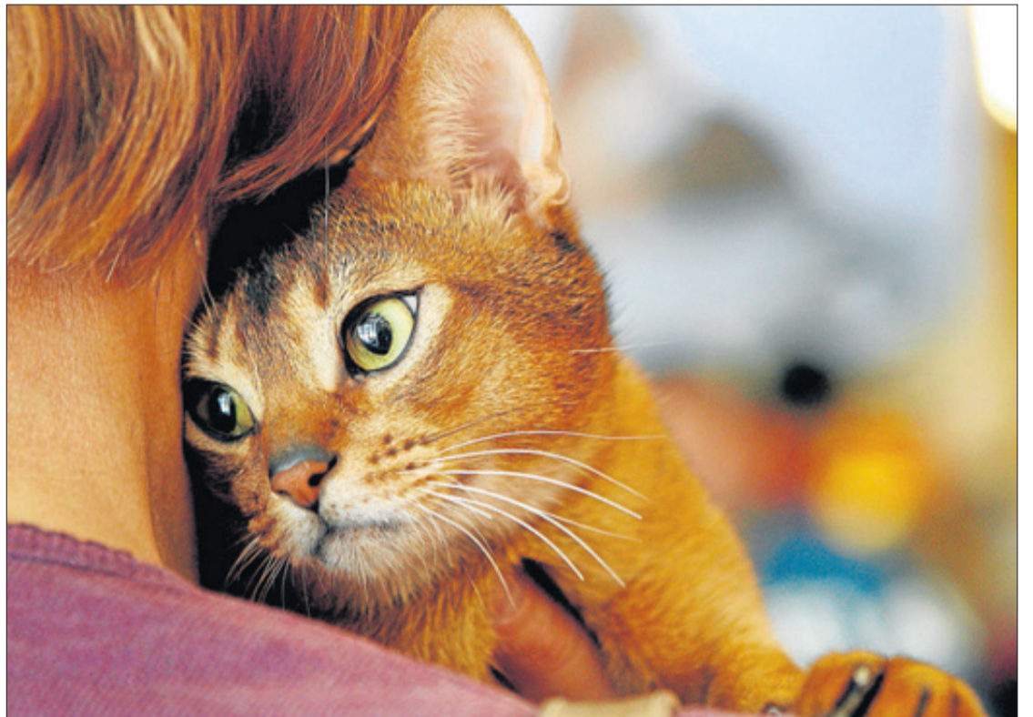
Una buena dieta es fundamental para tener una mascota sana.

Existen diversas patologías como, gastritis, cálculos, o colitis, que pueden llegar a curarse sin ayuda de fármacos.