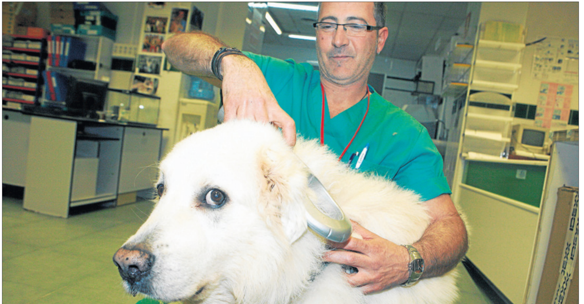
Los centros veterinarios de la provincia se encuentran entre los mejores de España por sus servicios y el nivel de los profesionales que los atienden. PILAR CORTÉS