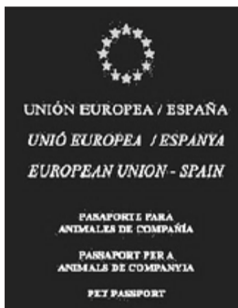
Pasaporte europeo de mascotas.

En el pasaporte se certifica que las vacunaciones de la mascota contra la rabia, y contiene detalles sobre otras vacunacio-