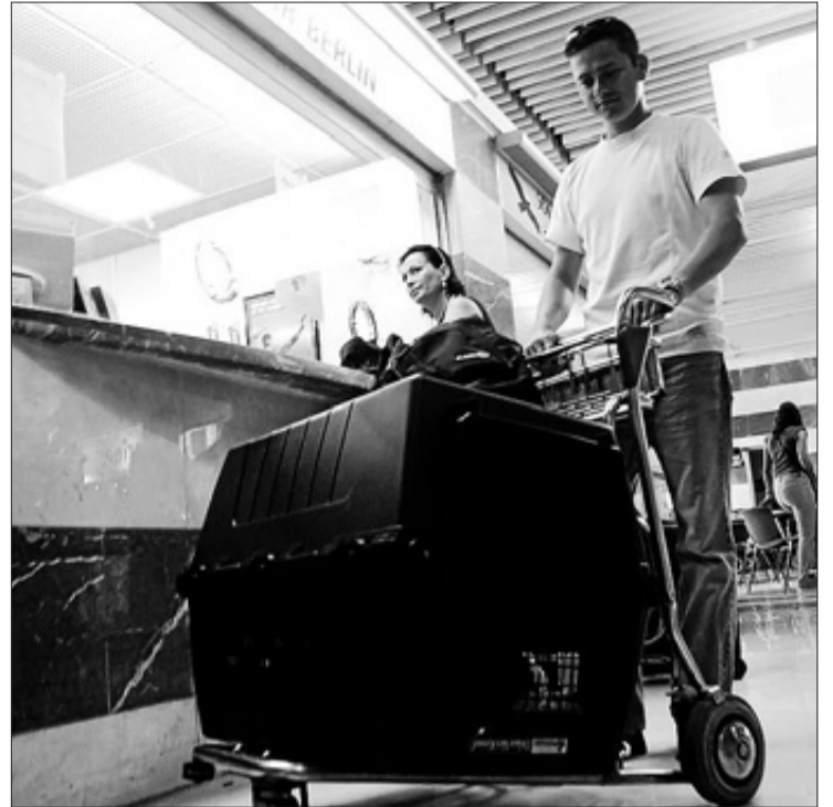
Varios animales de compañía, instantes antes de emprender viaje en el aeropuerto de El Altet, en imágenes de archivo.