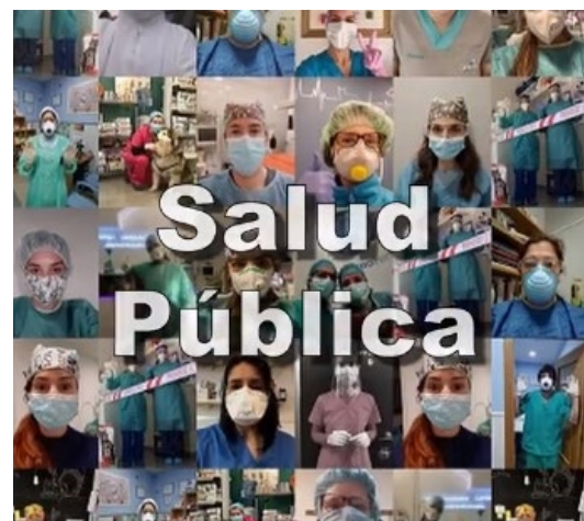
ICOVV, CON QUIEN SIGUE AL PIE DEL CAÑÓN- El Colegio de Valencia, a partir de las imágenes de profesionales en sus lugares de trabajo portando mascarilla que fueron remitidas en las últimas semanas a la entidad y con motivo del Día del Veterinario (27 de abril), editó un vídeo homenaje. Ver aquí