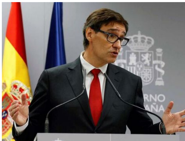
Rueda de prensa del ministro de Sanidad, Salvador Illa. Abajo, imagen de una prueba de PCR para Covid-19.

El malestar por esta marginación ya ha llegado al propio Congreso, donde el PP ha presentado una PNL en la que pide al Gobierno abordar la crisis sanitaria desde un enfoque One Health , contando más con los veterinarios. Este partido, además, ha propuesto que los presidentes de todos los consejos na-