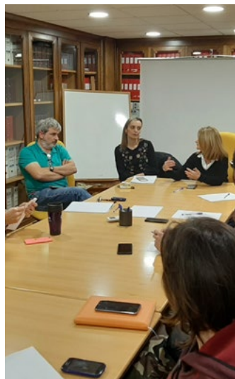
Imagen de archivo de la primera reunión de febrero.

En idéntico sentido, se planteó la necesidad de obtener información actualizada sobre la marcha de las acciones judiciales iniciadas por el citado consejo nacional contra los presuntos actos de intromisión por parte de este colectivo. Junto a ello, se planteó la conveniencia de instarle a que pre-