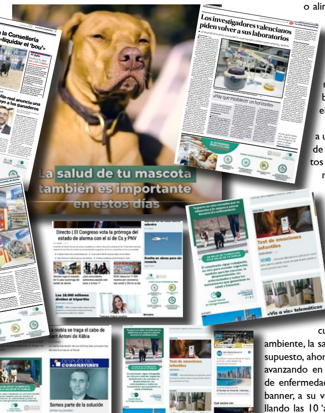
Collage de imágenes de la campaña publicitaria lanzada. En el centro un fotograma del vídeo editado. Alrededor imágenes de los banners o de las inserciones en las páginas de actualidad

La semana arrancó en los digitales de los periódicos reseñados difundiendo el mensaje en favor del sector clínico, especialmente castigado a causa de las restricciones decretadas en la movilidad y por la incertidumbre propia de la crisis sanitaria. Bajo el ya conocido eslogan de la 'Salud de