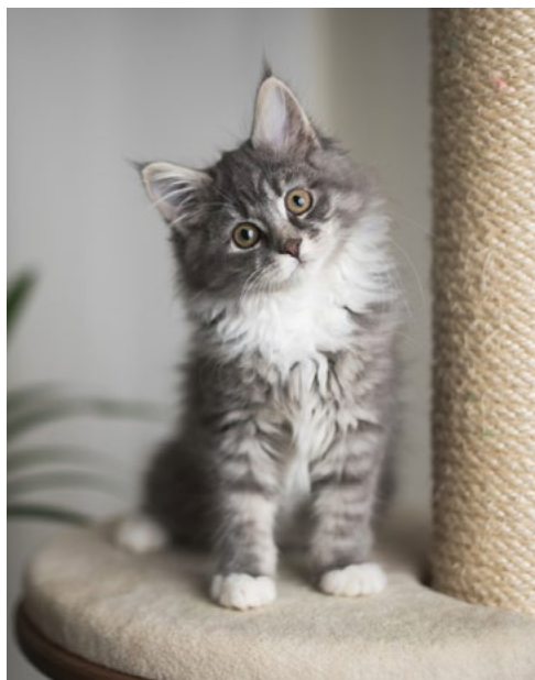
Algunos ayuntamientos están identificando ya los gatos callejeros de colonias felinas, ¿por qué no los de casa?

El documento remitido repasa someramente la situación creada en los centros veterinarios tras el estallido de la pandemia. Aún no existiendo a fecha de hoy evidencias de que los animales domésticos tengan relevancia en la transmisión de esta enfermedad, sí se han confir-