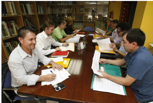
Junta de Gobierno

A lo largo del último año 2012, la Junta se ha reunido de forma periódica en convocatorias ordinarias y extraordinarias, donde se han abordado y tratado diferentes aspectos tanto de la gestión orgánica del Colegio, como del ejercicio de la profesión veterinaria en la provincia de Alicante. En total se celebraron 25 juntas, 12 ordinarias y 13 extraordinarias , con un total de 481 puntos tratados.