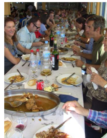
Celebración de la Festividad de San Fco, de Asís con los veterinarios jubilados y en Tabarca