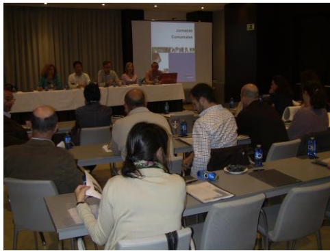
Reunión comarcal l'Alacantí II