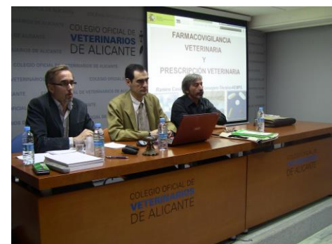
Jornada sobre Medicamentos