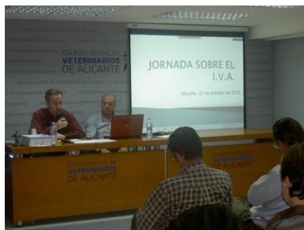
Jornada sobre el IVA