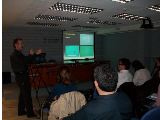
1 Curso de Actualización de Medicina y Cirugía del Aparato Respiratorio – 14 abril

En 2012 se diseñó un programa de formación con el objetivo de abordar diferentes especializaciones de la profesión veterinaria, tanto clínica como de producción animal. Como novedad, se realizaron seminarios on line que tuvieron muy buena acogida. Se organizaron un total de 13 cursos, registrando un total de 561 asistentes.