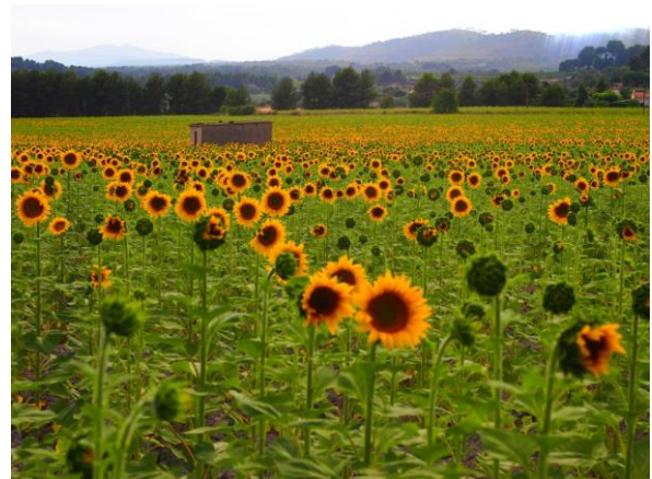
2º Girasoles. Autor: Javier González García.