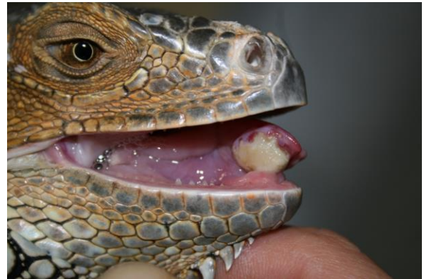
2º Lo tengo en la punta de la lengua. Autor: Francisco Javier García Roé