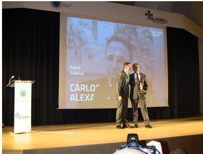
III Gala de la Salud de Alicante

Del mismo modo, con motivo de la celebración de la III Gala de la Salud , el Gabinete de Prensa participó en la comunicación del evento, junto con el resto de responsables de comunicación de colegios sanitarios de la provincia. La preparación de la rueda de prensa, la atención a los periodistas asistentes y la elaboración de un comunicado posterior y su envío a los medios especializados veterinarios, fueron sus cometidos.