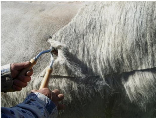
1º Rasurando la mula. Autora: M a Isabel Moreno del Prado.