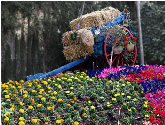
1º Explosión de color. Autor: Oscar Moreno Megías.